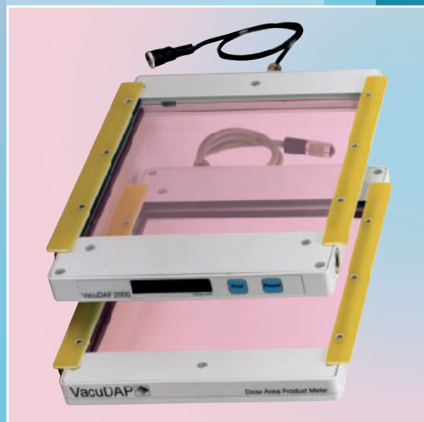
The measuring systems VacuDAP 2000/2001