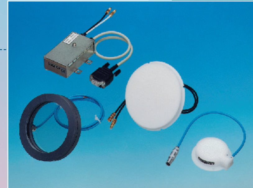
Circular ionization chambers for x-ray C-arms